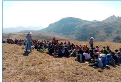
တမန်တော်လုပ်ငန်းအားဖြင့် ဆပ်ဖြေခြင်း