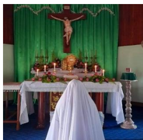
ကိုယ်တော်မြတ်စက္ကရမင်းမဂလာ အား ဝတ်ပြုဖူးမြော်ခြင်းအားဖြင့်