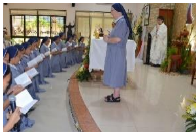
၅။ယာယီသစ္စာခံယူသောအဆင့် (Juniorate)