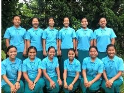
၁။လေ့လာသူအဆင့် (Search-in) ၂။ဝင်လိုသူအဆင့်(Aspirancy)

မွန်မြတ်သော ကိုယ်တော်မြတ်သာသနာပြုအစေခံသီလရှင်ဖြစ်ရန် အဆင့်များ