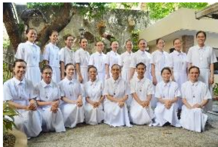
၄။သီလရှင်လောင်းအဆင့်(Novitiate)