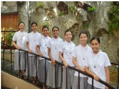
၃။တောင်းခံသူအဆင့် (Postulancy)